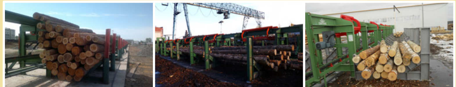
Selezione tronchi per diametro e lunghezza - Log sorting line by diameter and length - Сортировка брёвен по диаметру и длине