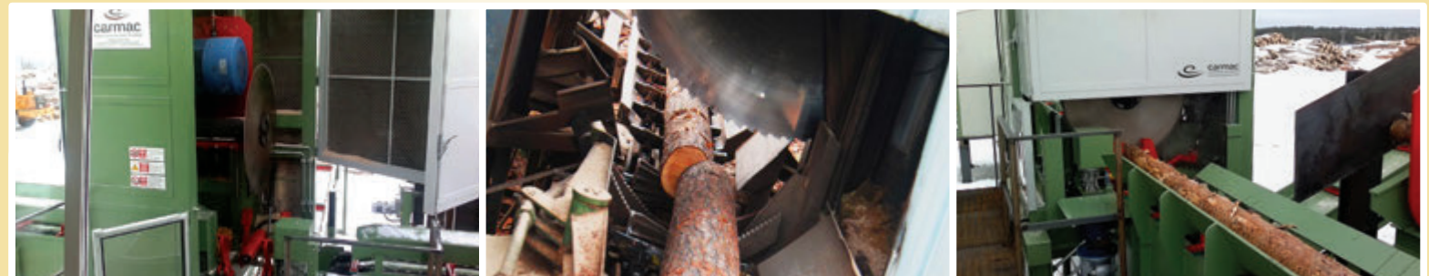
Sezionatrice per Tronchi - Log Trimmer - Торцовочный станок для брёвен