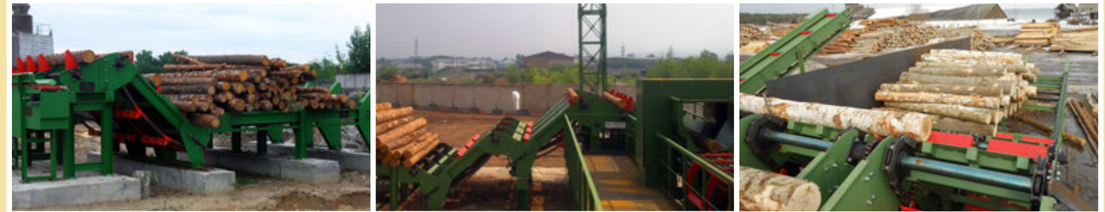
Gruppi completi di carico e scarico - Complete on/off load automation - Загрузочно-разгрузочные группы для лесопиления