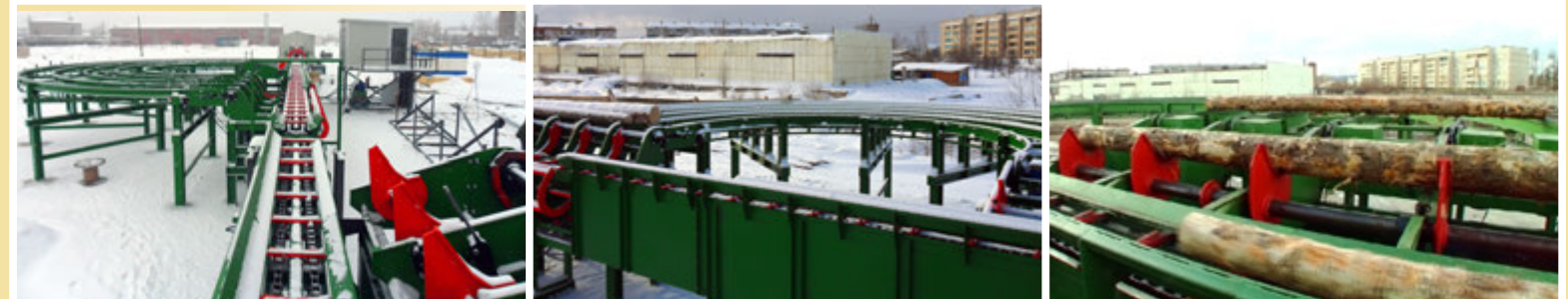
Giratronchi - Turn Logs - Цепное устройство для поворачивания бревна верного типа