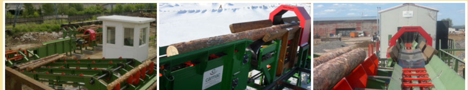
Cubatura dei tronchi con Metal Detector 3D - Volume Control and Metal Detector - Система кубатуры с металлодетектором